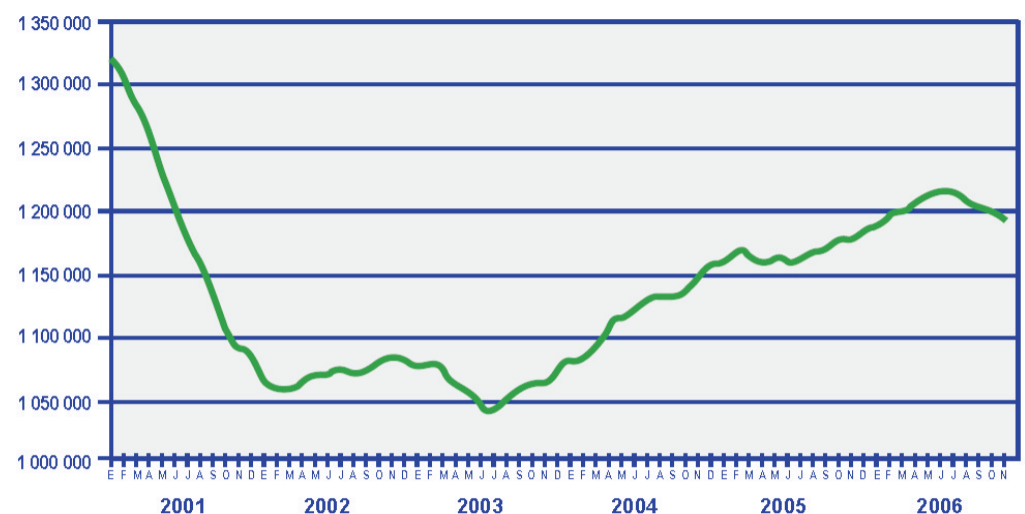
Figura 3. Serie desestacionalizada del personal ocupado en la industria maquiladora de exportación (Miles de personas)

La tasa de desocupación en el país ha crecido durante los últimos años (Fig. 1). Aunque es baja en comparación con otros países, debe subrayarse que es importante en condiciones en las que no existen paliativos como el seguro de desempleo. El denominado empleo en condiciones críticas es aún más significativo, de acuerdo con los datos del INEGI. Estos efectos son también claros en el empleo, particularmente en el sector manufacturero (Fig. 2).