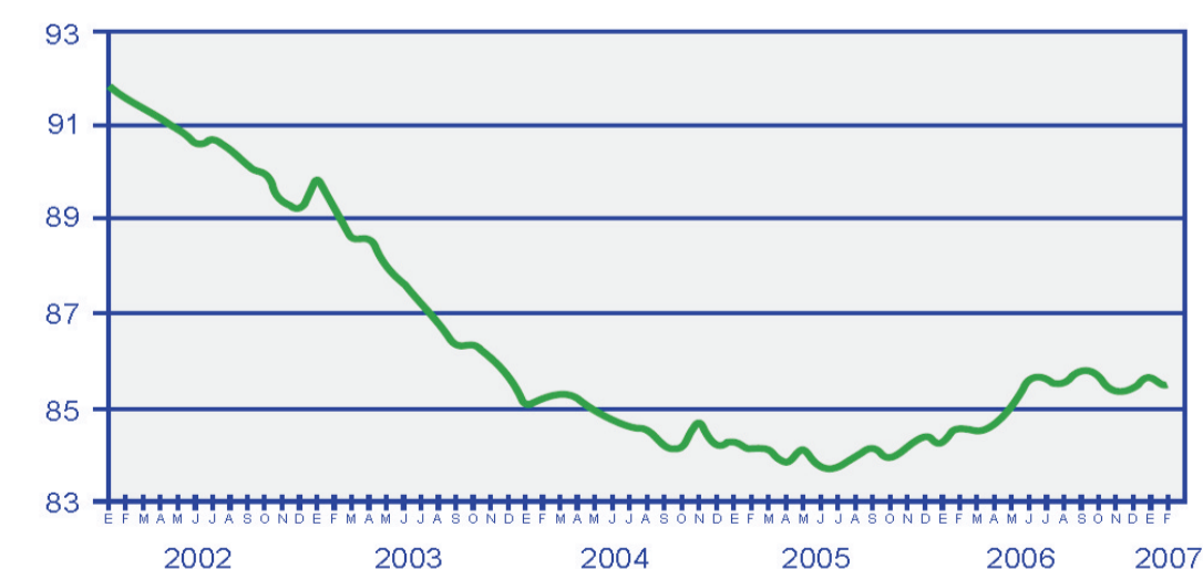
Figura 2. Serie desestacionalizada del personal ocupado en el sector manufacturero (índice 1993=100).

Los resultados de esta transformación radical de la política económica no han sido uniformes ni sectorial ni regionalmente y sus efectos en los distintos estratos de la población han incrementado la desigualdad y la pobreza. La simple apertura de una economía a la competencia internacional no proporciona mecanismos internos para el desarrollo. Basar una estrategia de desarrollo económico en la dinámica del mercado como ingrediente principal, sin la presencia del Estado como articulador de una política industrial, de la inversión y del desarrollo de las condiciones educativas y de infraestructura para la competitividad, no funciona.