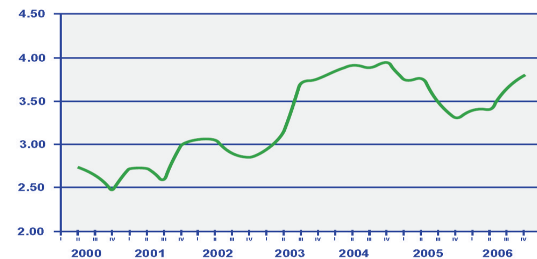
Figura 1. Tasa de desocupación unificada con criterios ENOE. Tipo de serie: desestacionalizada (Corte: trimestral. Ámbito: Nacional. Período 2000-2006)

El largo periodo de la transición mexicana hacia una nueva política económica orientada al mercado internacional ha representado cambios significativos en las medidas de política y costos radicales en los ajustes. El periodo de crecimiento sostenido sin inflación y con estabilidad cambiaria basado en la industrialización por sustitución de importaciones estableció medidas de protección arancelaria, subsidios, exenciones de impuestos, control oficial de las organizaciones obreras, control salarial y de precios de productos básicos como principios organizativos de la economía. La crisis de este modelo provocó el crecimiento exponencial de la deuda externa y el control estatal de una parte importante de la industria manufacturera.